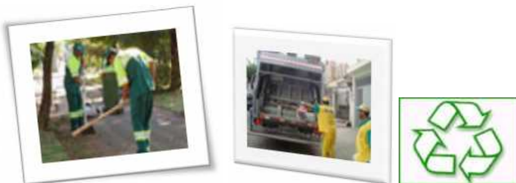
Novo modelo de limpeza urbana visando à melhora na drenagem de águas pluviais e incentivo à coleta seletiva.

Destacamos, também, o serviço de limpeza urbana que tendo concluído as contratações previstas na Lei nº 13.478, de 30 de dezembro de 2002, instalou a Autoridade Municipal de Limpeza Urbana – AMLURB, que estará em efetiva operação a partir de 2013, porém, esse serviço já resulta em efeitos positivos neste exercício, com a cobertura integral dos serviços de varrição e outros modelos de coleta de resíduos domiciliares, a instalação de contêineres subterrâneos, conjugado ao incentivo à Coleta Seletiva e instalação de Ecopontos em toda a Cidade, vislumbrando assim, uma nova fase para este tipo de serviço urbano.