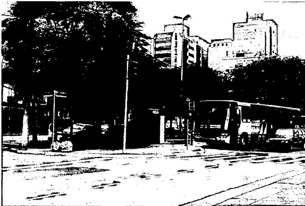
Praça vista pelo canteiro central da Avenida Faria Lima, altura do nº 201, na confluência com a Rua Coropés