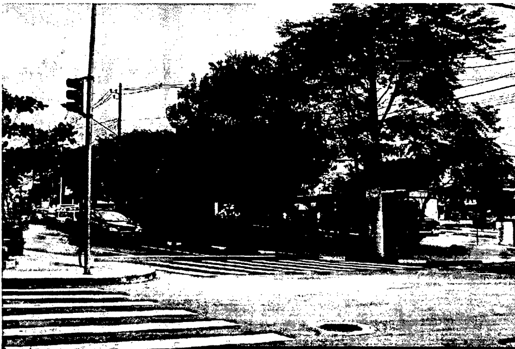
Praça vista pela Rua Coropés, altura do nº 108, confluência com a Rua Cunha Gago