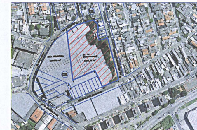
SITUAÇÃO SEM ESCALA